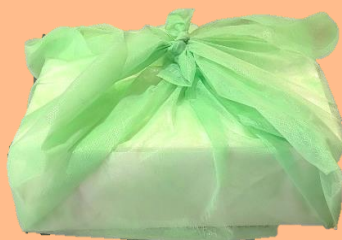
ゴルフの参加賞として 箱入り1300円セット